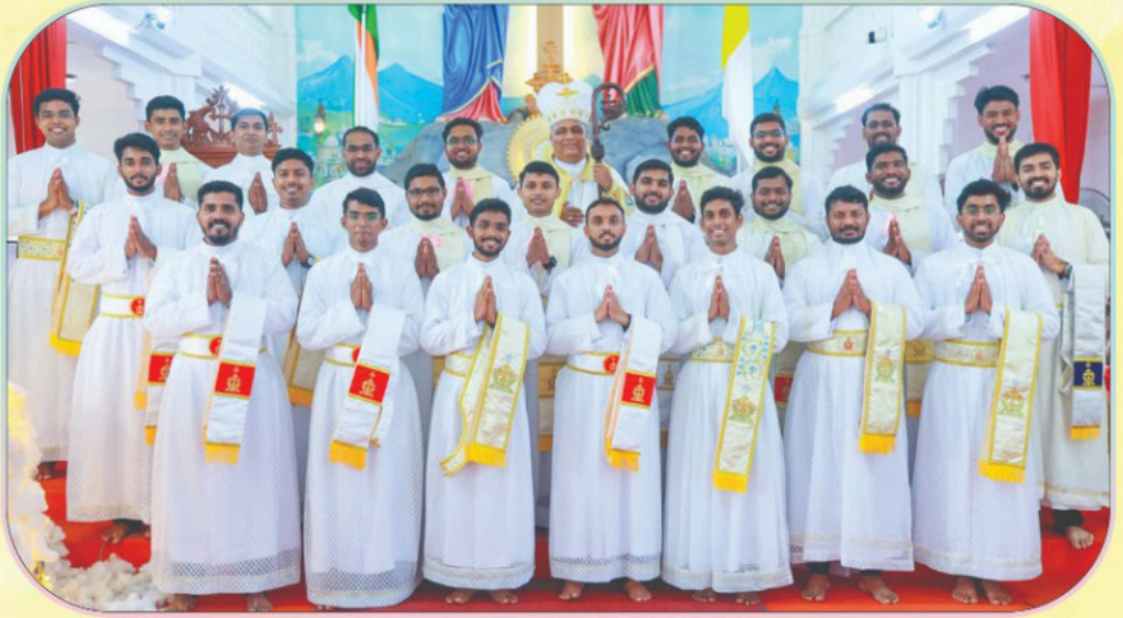
തലശ്ശേരി അതിരൂപതയ്ക്കുവേണ്ടി കാനോസ്യൂസ, ഹെവ്'പരിയാക്കോനൂസ പട്ടണൽ സ്വീകരിച്ച വൈദികവിദ്യാർത്ഥികൾ അഭിവന്ദ്യ പിതാവിനോടൊപ്പം ഏപ്രിൽ 22, 2026