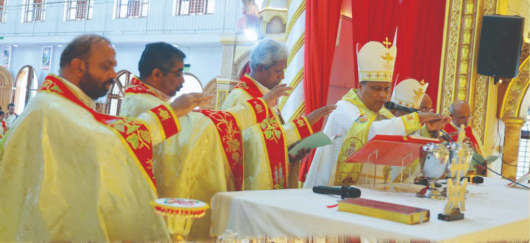
വി. മുറോൻതൈല വെഞ്ചരിക് സെന്റ് മേരീസ് ഫൊറോനാ ദൈവാലയം, ആലക്കോട് മാർച്ച് 30, 2026