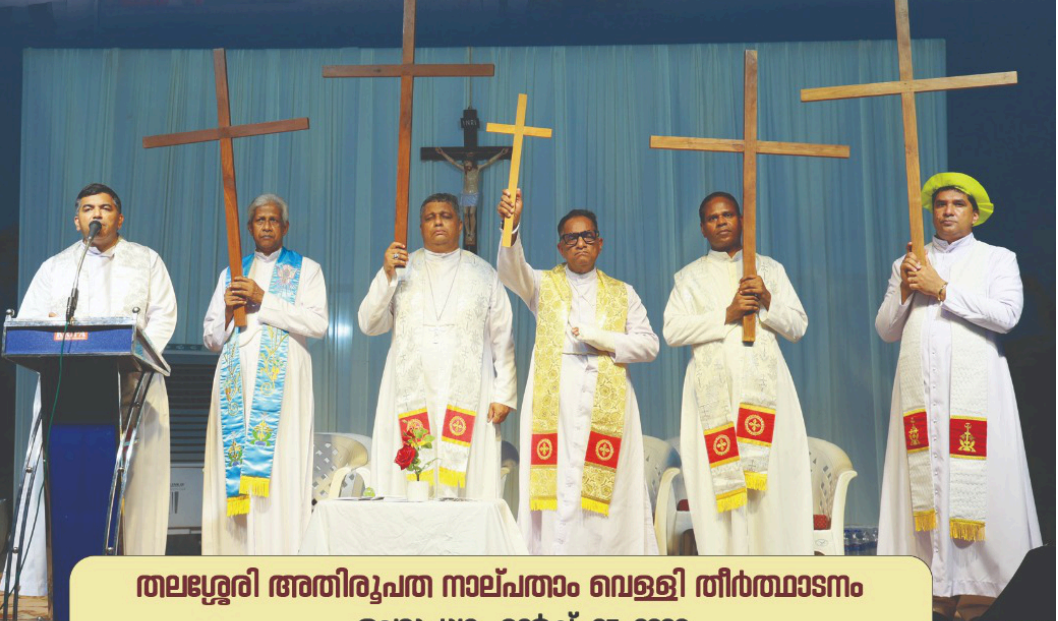
തലശ്ശേരി അതിരൂപത നാല്പതാം വെള്ളി തീർത്ഥാടനം ചൊവ്വ, മാർച്ച് 27, 2026