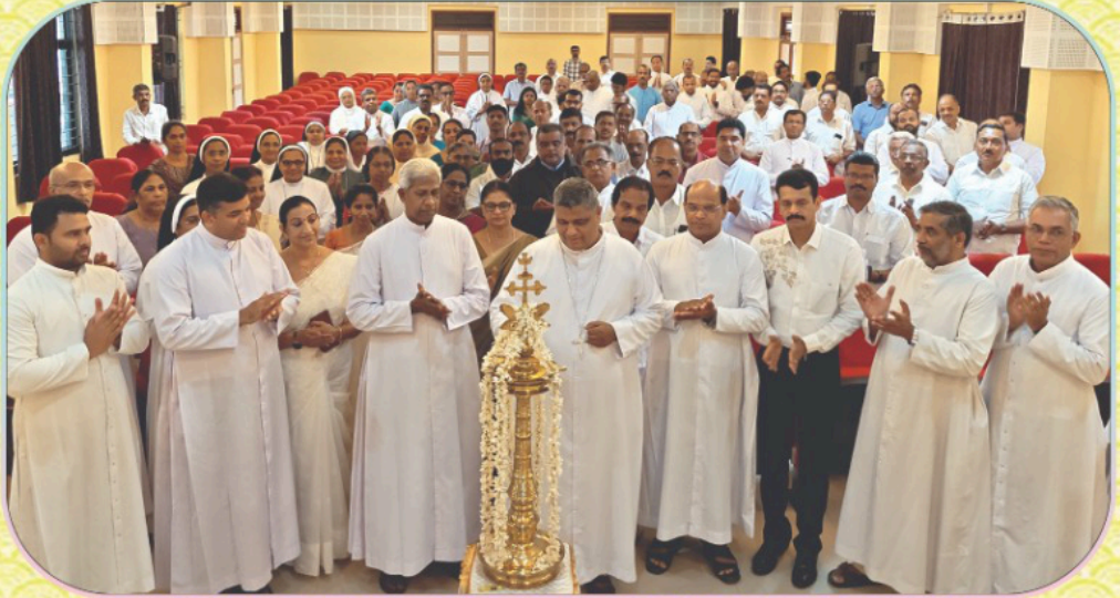
തലശ്ശേരി അതിരൂപതയുടെ 19 മത് പാസ്റ്ററൽ കൗൺസിലിന്റെ അവസാനയോഗം മാർ ജോസഫ് പാംപ്ലാനി പിതാവ് ഉദ്ഘാടനം ചെയ്യുന്നു. ഖബ്രേരി, ഏപ്രിൽ 21, 2026