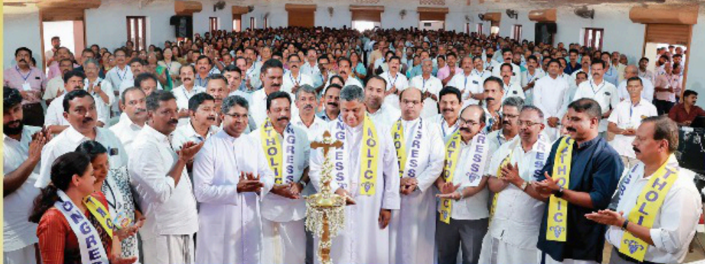
കന്യാശാലയിലെ കോൺഗ്രസ്സ് നിലയ്ക്കൂരി അതിരൂപത നേതൃസമേതനവും ഏറ്റവും സജീവമായി പങ്കെടുത്തു വന്നു സമിതി ഭാരവാഹികൾക്ക് സ്വീകരണവും ഏപ്രിൽ, 2025 ഫെബ്രുവരി 08