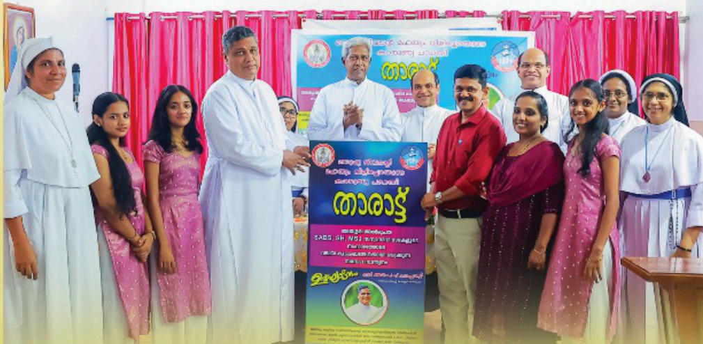
സമുദായ ശക്തികരണ വർഷാചരണത്തിന്റെ ഭാഗമായി നിലയ്ക്കൂരി അതിരൂപതാംഗങ്ങളായ മാതാപിതാക്കൾക്ക് നാലാമത്തെ കുട്ടി ജനിക്കുമ്പോൾ പ്രവചനസംബന്ധമായ ചികിത്സകൾ സൗജന്യമായി നൽകുന്ന താരാട്ട് പദ്ധതി അഭിവന്ദ്യ പിതാവ് ഉദ്ഘാടനം ചെയ്തു. നിലയ്ക്കൂരി, 2025 ജൂൺ 27