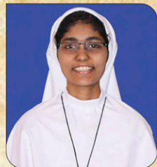
സി. ലോണ തെരേസ് S H